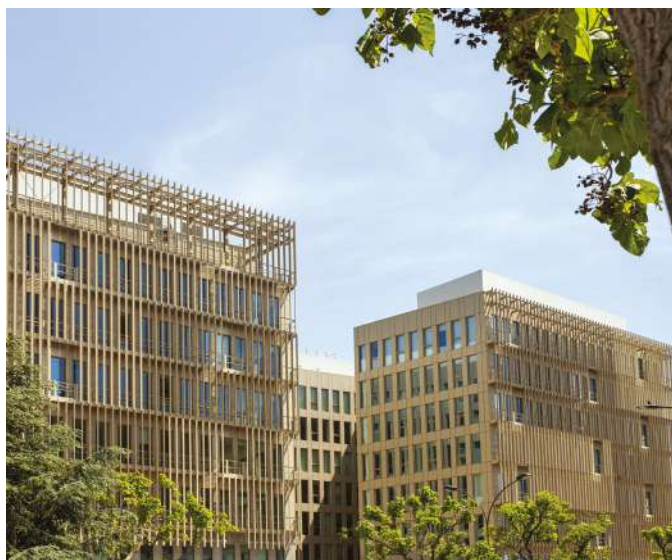
▲ 126-138 avenue de Stalingrad - VILLEJUIF (94)