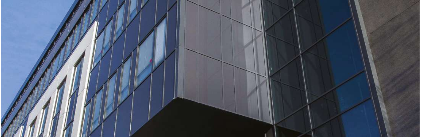
Proxima V - 1, rue Edison – Guyancourt (Yvelines)